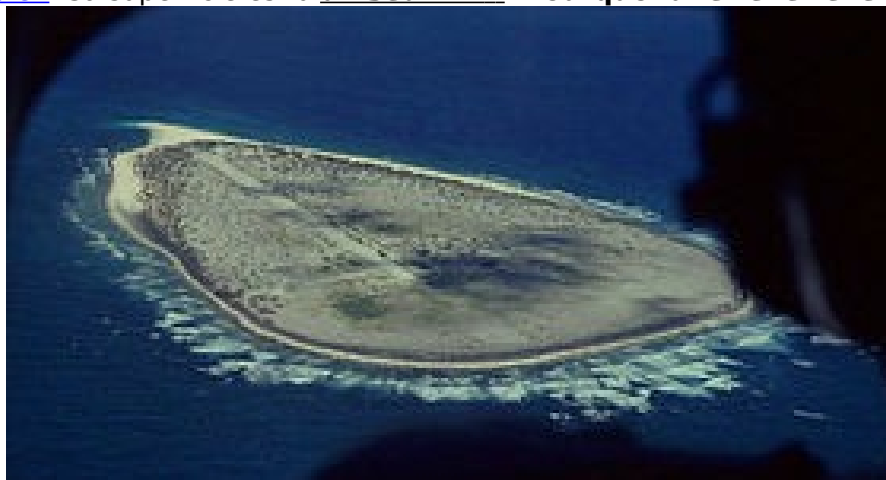
Vue aérienne de l'île

encore LA REUNION et un écheveau de petites îles autour. L'île Maurice, autrefois cogérée par la France et l'Angleterre, est devenue une république autonome cogérée uniquement avec l'Angleterre. Après avoir glissé concrètement dans l'escarcelle de la Perfide Albion, elle réclame encore quelque chose de plus : l'île de TROMELIN . Cette île corallienne fait 3,7 km de tour, comporte une piste d'atterrissage et quelques bâtiments habités par quelques militaires et techniciens. Elle est située à 535 km au Nord de LA REUNION et à 450 km à l'EST de MADAGASCAR dans l' Océan Indien . Sa superficie est d' un seul km 2 ! Pourquoi une telle revendication ?